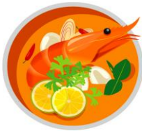
dōng yīng ōng 冬阴功