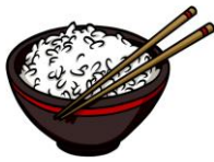
mǐ fàn 米饭 ข้าวสวย