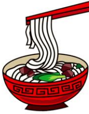
miàntiáo 面条 ก๋วยเตี๋ยว