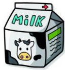
niúǎi 牛奶 นม