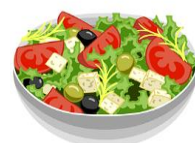
shā lā 沙拉