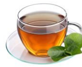
chá 茶 ชา