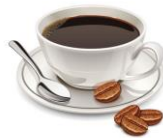
kāfēi 咖啡 กาแฟ