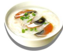
zhōu 粥 โจ๊ก, ข้าวต้ม