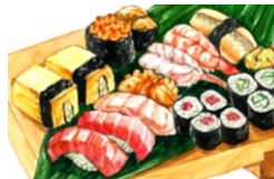
shòu sī 寿司