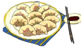
jiǎo zi 饺子