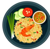
chǎo fàn 炒饭 ข้าวผัด